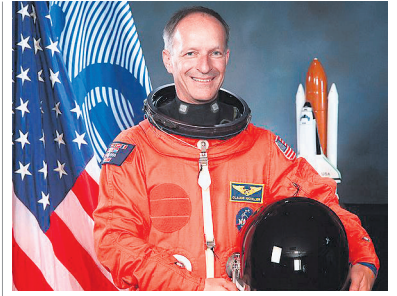
Claude Nicollier.

Logo Fahrzeugen der TBK unterwegs. Im Zweifelsfall sollte der Zutritt zur Wohnung verweigert und bei den Firmen oder Behörden abgeklärt werden, ob es sich um einen Mitarbeiter handelt. Personen, die ebenfalls kontaktiert worden sind, werden gebeten, sich umgehend beim Kantonspolizeiposten Kreuzlingen unter 058 345 20 00 zu melden. IDK