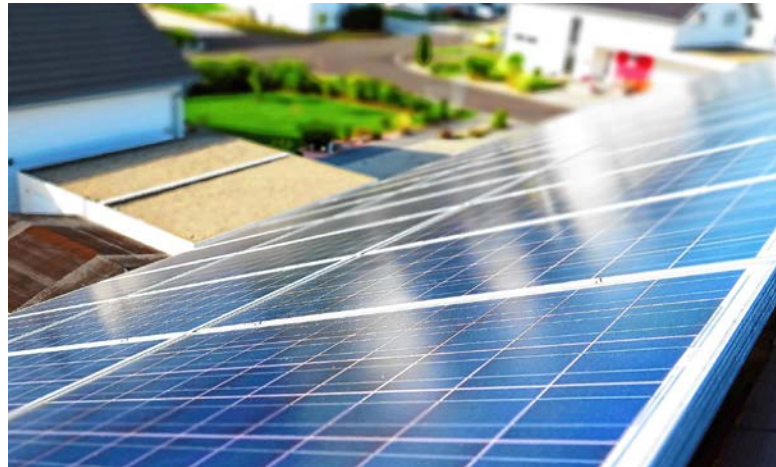
Bei einem neuen Wohnbau gilt ab dem 1. Juli 2020, dass ein Teil des Stroms selbst erzeugt werden muss. Wird darauf verzichtet, ist ein strengerer Grenzwert für den maximal zulässigen Energiebedarf des Gebäudes einzuhalten.

Rund drei Viertel der Wohnbauten tangiert die neue Gesetzgebung nicht. Bei ihnen kann ohne weitere Massnahmen wieder eine fossile Heizung