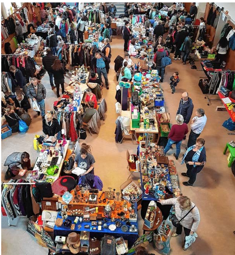
Am Flohmarkt hat es viele preisgünstige Angebote.