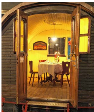
Ein tolles Erlebnis: Speisen im Zirkuswagen.

Die Abstands- und Hygienemassnahmen werden jederzeit eingehalten.