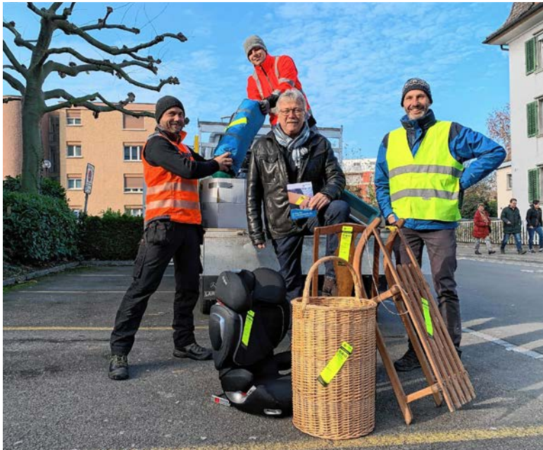
Die Kleingutsammlung wird als Dienstleistung weiterhin angeboten.

Der Stadtrat will das Angebot jedoch aufrechterhalten und suchte nach einer Lösung. Ab dem neuen Jahr wird das Männerprojekt des Dienstleistungszentrums Arbeitsintegration die Kleinsperr-