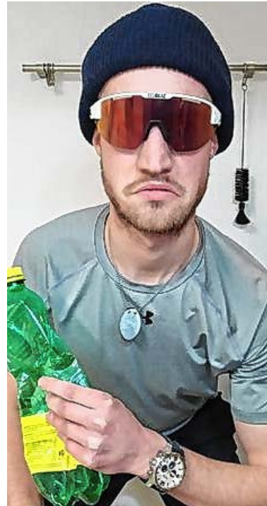
Der Täter: Cyrill Langfinger.