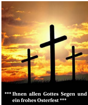
*** Ihnen allen Gottes Segen und ein frohes Osterfest ***

Nachdem letztes Jahr aus Pandemie-Gründen die Osternachtfeier leider entfallen musste, wollen wir in diesem Jahr eine «meditative Taizé-Andacht unter Corona-Bedingungen» feiern und uns mit vielen Kerzen, Schweigen und Musik auf das Geheimnis der Auferstehung einstimmen. Die mit Tüchern und Licht ge-