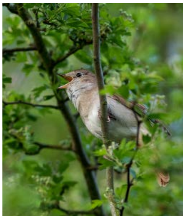
IDK Die schöne Nachtigall.

Anmeldungen sind telefonisch unter 079 341 18 39 oder per E-Mail vs.kreuzlingen@outlook.com möglich.