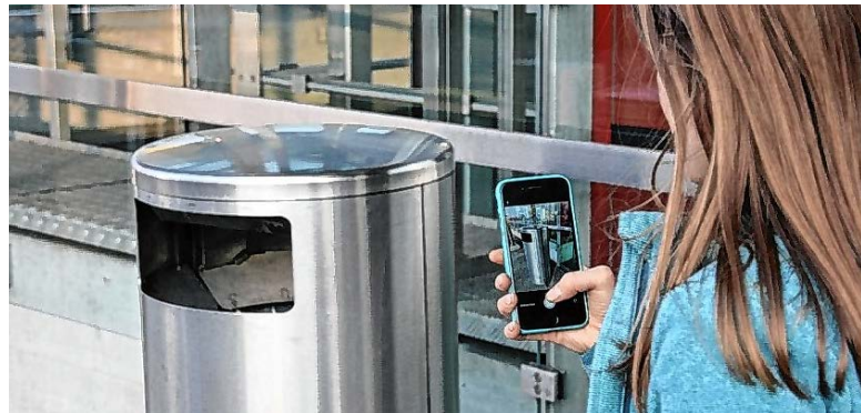
Tägerwilen als Pilotgemeinde: Mit der neuen App Müllkübel markieren, Abfall richtig entsorgen und dafür belohnt werden.

Für jeden Mülleimer und für jede korrekte Abfallentsorgung erhalten die User Punkte, welche im «Green Marketplace» der App in nachhaltige Belohnungen eingetauscht werden können. Nebst den nationalen Partnern sind insbesondere lokale Geschäfte und Dienstleister gesucht, die unsere Um-