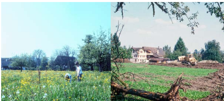
Eine Blumenwiese mitten im Dorf und dann fuhren die Bagger auf.