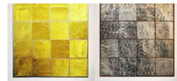
«Nobody Is Perfect» von Gérard Cornioley

Nutzen Sie die letzte Chance, diese spezielle Ausstellung erstmals oder nochmals zu besuchen. Coronabedingt gilt Maskenpflicht und auf Speis und Trank muss verzichtet werden.