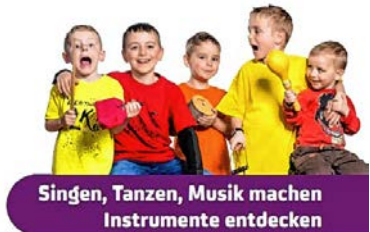
Singen, Tanzen, Musik machen Instrumente entdecken

Kostenloser Schnuppertermin ohne Anmeldung für Kinder von vier bis sieben Jahren am Dienstag, 1. Juni und am Dienstag, 24. August von 13.45 bis 14.35 Uhr im Pavillon neben dem Kindertreff. Anmeldeschluss 30. August 2021.