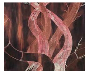
«Die Kraft des Bambur» von Ros Hartmann