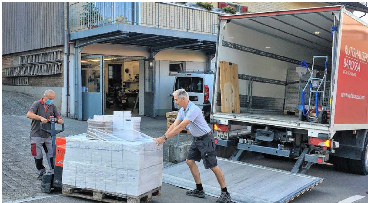
Der Tägerwiler Wein, Jg. 2020, ist eingetroffen.