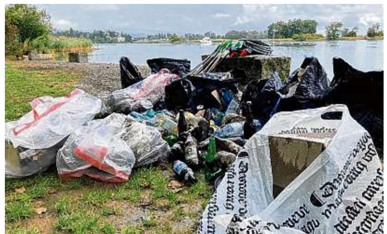
Die Freiwilligen haben säckeweise Müll aus dem Tägermoos gesammelt.

unzählige Zigarettenscheitel und Kronkorken, dutzende Glas- und PET-Flaschen, unzählige Aludosen, jede Menge Plastikketzen und einige exotische Fundstücke wie verrostete Metallrohre waren unter den Fundstücken. Die gesammelten Abfälle - die nun nicht mehr in der Natur liegen, den Boden und das Wasser vergiften oder ins Meer gespült werden können - wurden fachgerecht getrennt und zum Recyceln vorbereitet. Somit landen die wertvollen Rohstoffe wieder im Kreislauf und schonen die Ressourcen. Zur Stärkung und als Dank wurde allen Teilnehmenden von der Gemeinde Tägerwilen ein Imbiss im Restaurant Kuhorn offeriert. In gemütlicher Runde gab es dabei Gelegenheit, sich noch weiter über Abfall und Konsum auszutauschen. Die Naturkommission plant weitere Clean-up-Aktionen durchzu-