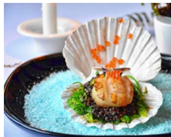
Gourmetschmaus in Tägerwilen.