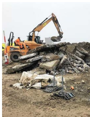
Baugrube mit Aushub des ersten Bunkers.

Am 11. Oktober 2021 haben die Bauarbeiten für die neue Bushaltestelle beim Bahnhof Lengwil begonnen. Der bisherige Belag wurde bereits abgetragen. Die erstellten Randabschlüsse lassen die Grösse des Projektes erkennen. Im Sinne eines Zwischenstopps sind zudem zwei kleinere Bunker, welche sich unter der geplanten Bushaltestelle befanden, fachgerecht abgetragen und entsorgt worden. Das Bauwerk wird wie geplant bis zur Einführung des neuen Busfahrplans vom 12. Dezember 2021 fertiggestellt. Im Rahmen des Adventsfensters vom 14. Dezember 2021 findet eine kleine Einweihungsfeier für die Bevölkerung statt.