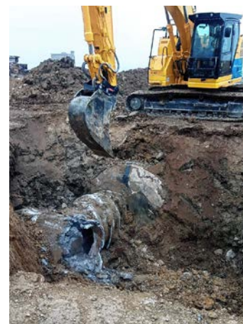
Abbruch des Personendurchgangs zum zweiten Unterstand.