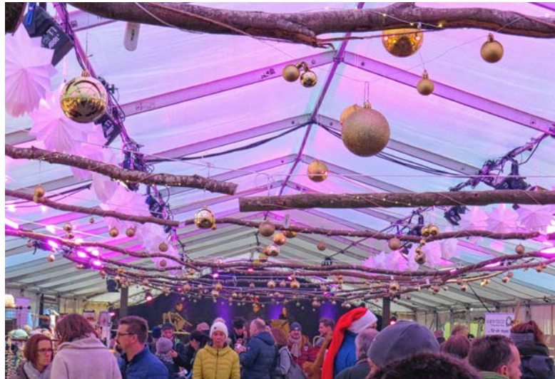
Heute, 16 Uhr, wird das Weihnachtszelt eröffnet.

Die Durchführung von «Das Weihnachtszelt» ist nicht gefährdet. Der Kreuzlinger Weihnachtsmarkt auf dem Bärenplatz kann trotz der weiter verschärften Covid-Massnahmen stattfinden. Der Thurgau hat am Mittwoch eine Ausweitung der Maskenpflicht bekannt gegeben. Daher gilt für «Das Weihnachtszelt» neu eine Maskenpflicht auf dem ganzen Gelände, also auch im Aussenbereich. Konsumationen sind im Sitzen erlaubt. Das OK wird deshalb dafür besorgt sein, dass genügend Sitzgelegenheiten zur Verfügung stehen. Wie bereits angekündigt besteht in den grossen Zelten eine Zertifikatspflicht, der Rest des Festplatzes ist frei zugänglich. Es können also alle Besucherinnen und Besucher durch das Areal schlendern, sich an einem der Take-Away-Ständen etwas Feines zu essen oder zu trinken holen und auf dem Festplatz die vorweihnachtliche Stimmung geniessen. Eröffnet wird «Das Weihnachtszelt» am Freitag, 3. Dezember, um 16 Uhr. Die